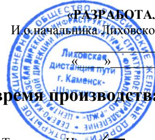
Схема ограждения ж.д. переезда 99 км пер. Тацинская – Быстрореченская на время производства путевых работ.